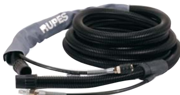
Шланги для пневматических машин