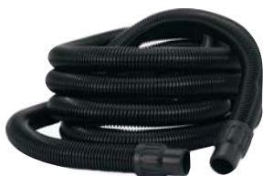
Slangen voor elektrisch gereedschap