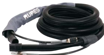
Slangen voor persluchtgereedschap